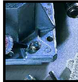
Loctite® 290 Fijador Grado Capilar