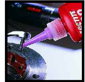
Loctite® 222 Fijador de Resistencia Media